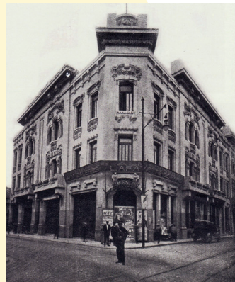
El Palais Concert

En 1919 fue elegido para representar a Ica en el Congreso Regional del Centro. Al cumplir esta función, asistió a una reunión en Ayacucho, en la que sufrió una caída que le provocó serios daños en la columna y, tras varios días de agonía, la muerte.