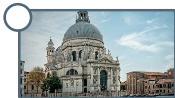
Santa María Della Salute

12. Observa las siguientes imágenes e identifica cuáles corresponden al estilo modernista.