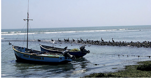
Caleta de San Andrés, Ica.

14. ¿Qué importancia tiene el paisaje en los cuentos de Abraham Valdelomar?