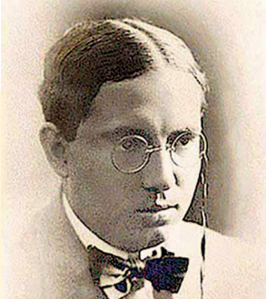
Abraham Valdelomar

Abraham Valdelomar nació en Ica, en 1888. Su infancia trascurrió en Pisco, cuyo puerto y paisaje influyeron más tarde en su obra. Trabajó como dibujante en la famosa revista Monos y Monadas y fue director de El Peruano . También ejerció como periodista en La Prensa , donde usó el seudónimo de El Conde de Lemos.