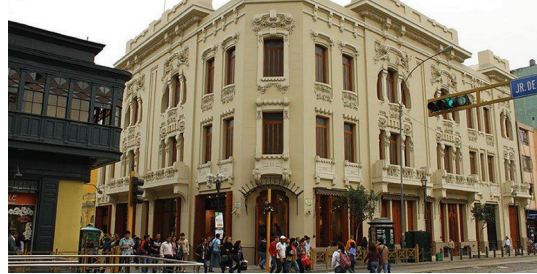
Palais Concert en Jirón de la Unicón, Lima.