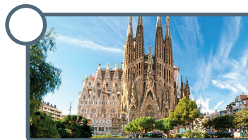
Catedral de la Sagrada Familia