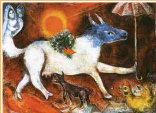
Vaca con sombrilla - Marc Chagall

Son muchos los artistas que a lo largo de la historia han declarado su afecto y admiración por los animales. En esculturas y pinturas, en dibujos e historietas han plasmado la ternura, la fuerza, el temor y la simpatía que les despiertan. Pintores como Marc Chagall, Franz Marc o Joshua Reynolds han dado expresión y vida a perros, vacas, caballos, zorros que, solos o en compañía de humanos realmente conmueven al espectador