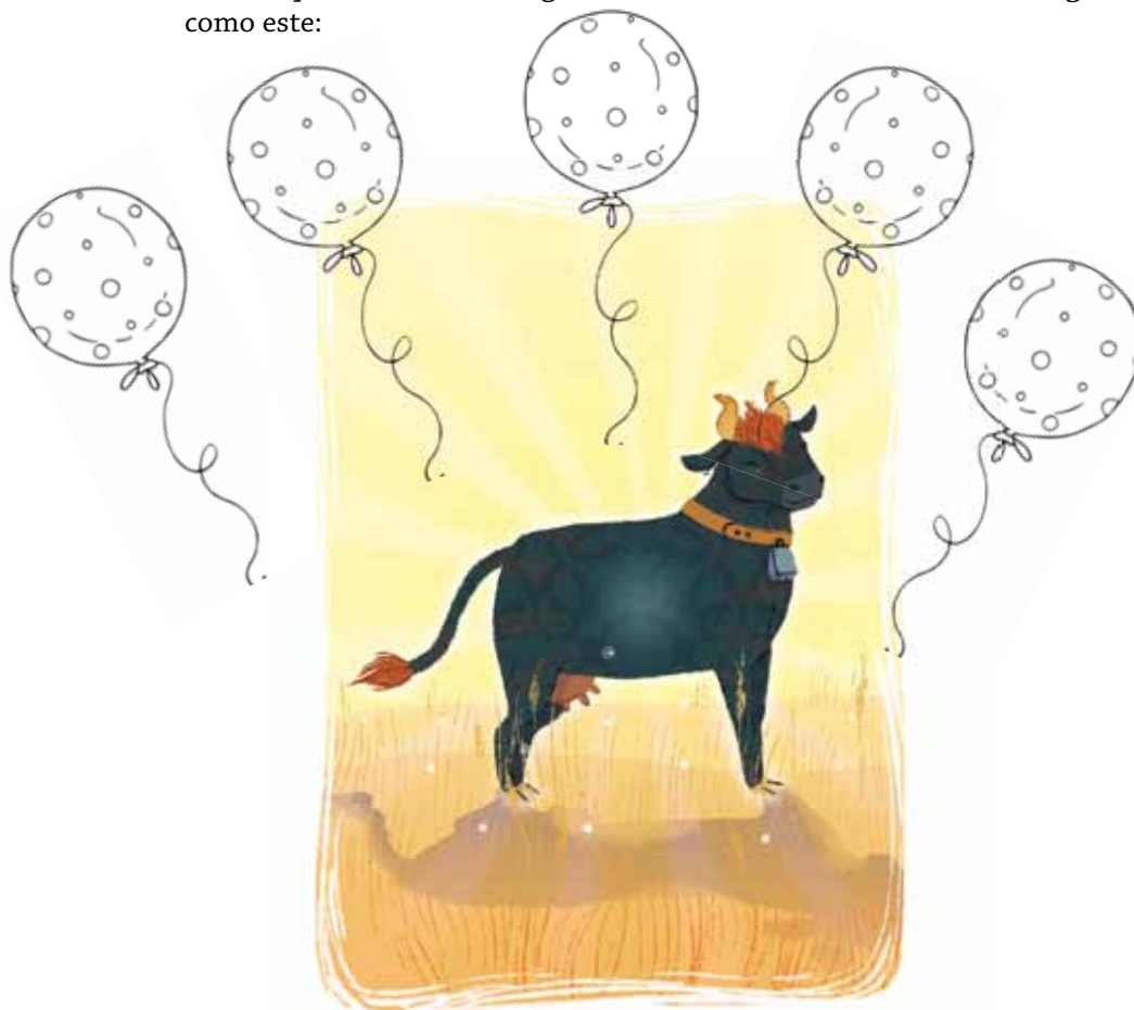
La vaca más vaca